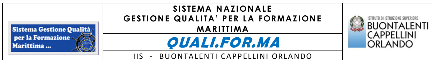
FIGURE DEL SISTEMA GESTIONE QUALITÀ